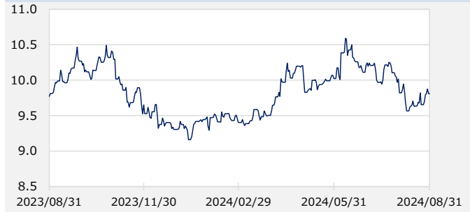
FTSE WGBIメキシコ国債 最終利回り（%）