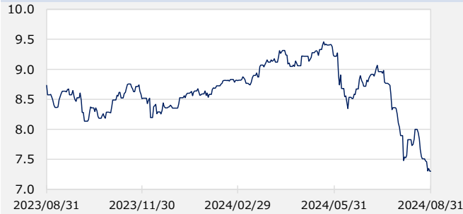
円/メキシコペソ（円）